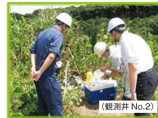
8月7日 県による立入調査の状況